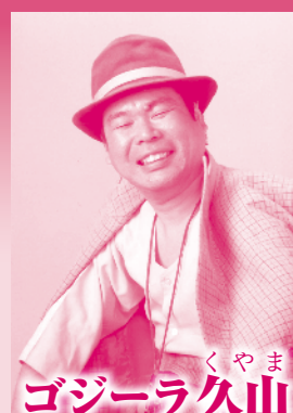
くやま ゴジラ久山 ものまねショー